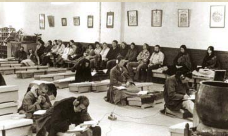
圖：1970年代，於金山禪寺，弟子們正在聽上人講述《華嚴經》。相片裡，使用耳機的，是為了方便弟子們在翻譯英文時，同時可以聽中文。在隔音室，其他的弟子們，則一邊聽中文，一邊翻譯並打字成英文講稿。