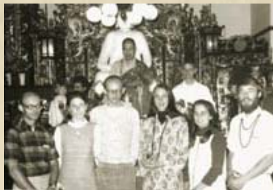
圖：1968年，上人為30多位美籍的大學生，舉辦98天的「暑期楞嚴講修班」。

有人問上人，如何教化美國人，上人便把他一九六八年在三藩市舉辦暑期班，在美國首次講講演《楞嚴經》的情形，簡略敘述一下，又把他不准三藩市地震的故事，風趣地重述一遍。十一點了，台下聽眾愈聽愈興奮，精神抖擻，情緒熱烈。