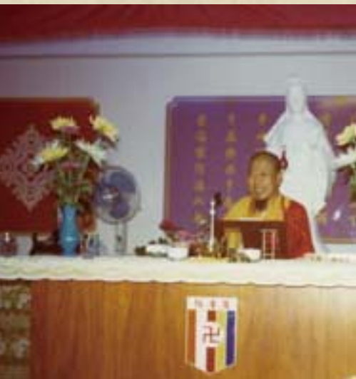
圖：上人在慧音社講述《地藏經》。

今早在預定的程式表上，大大地改變了。我們在檳城逗留的幾天，節目原本排得滿滿的，不是去這間廟上參觀，就是去那個庵堂用齋，每天要去八、九個地方，恍如旅行團走馬看花般熱鬧。