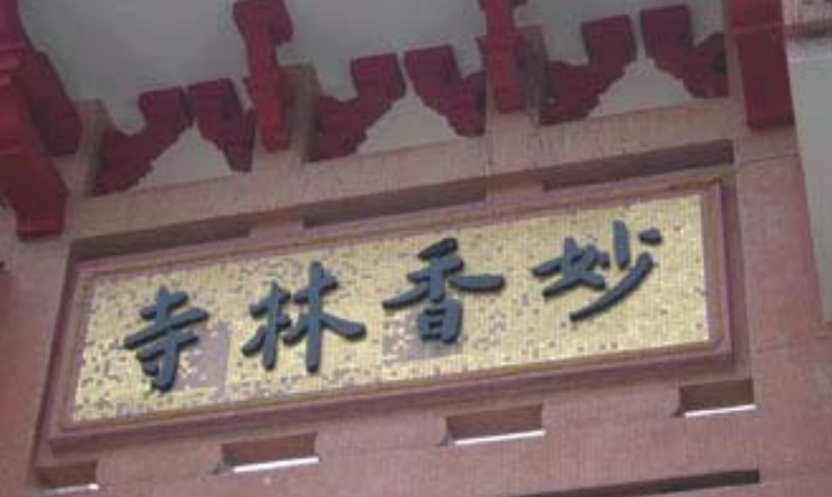
圖：2005年10月攝。妙香林寺，建於1942年，位於檳城名勝地升旗山的山麓。