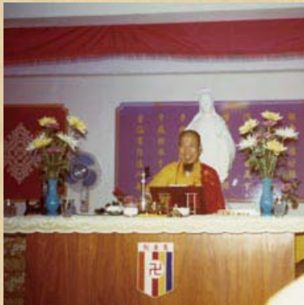
圖：上人於慧音社講《地藏經》

中美佛教總會。最近，更創建「萬佛城」，設立法界大學，其無量菩薩行，無量善巧方便，早為教內外人士所同聲歌頌。