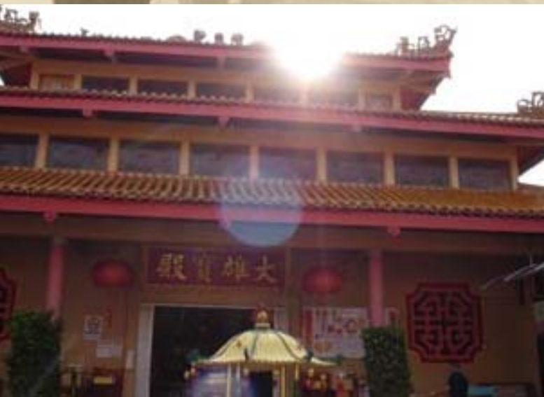
圖：2006年3月攝， 金馬崙三寶萬佛寺。

了做人，將來便可成佛。所謂『君子務本，本立而道生』，做人先要掌握著基本，道就自然地生出來。道就是修行的方法。又云：『孝悌也者，其爲人之本歟。』所謂『孝』者，就是敦品立德。