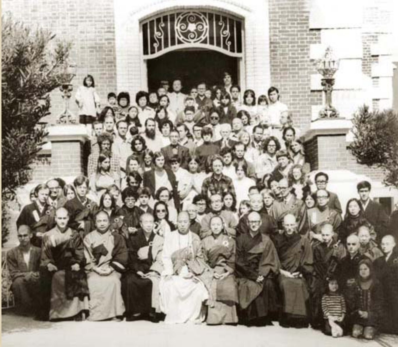
1973年，國際譯經學院開光典禮於三藩市。 許多首版的英譯佛教經典，都在這裡完成的。 育良小學也於1976年在此成立。