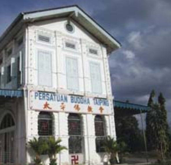
圖：2005年10月攝。 太平，是馬來西亞最 古老的市鎮之一，舊 稱「拉律」。